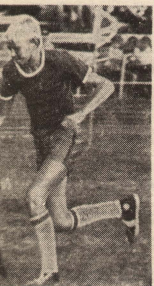
«Прометей» из Казани.